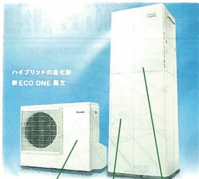
ハイブリッドの進化型 新ECO ONE 誕生